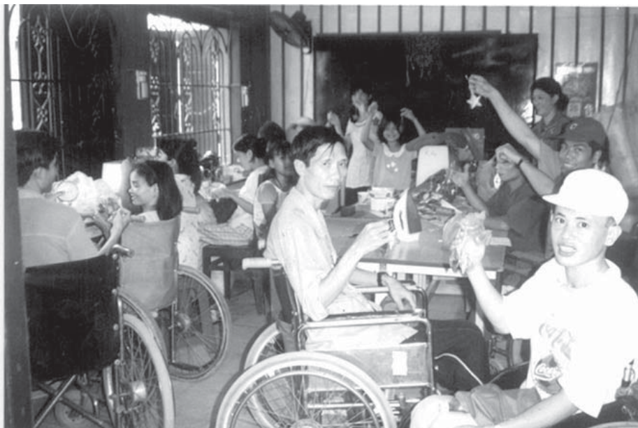
Maison Chance, atelier de production des étoiles