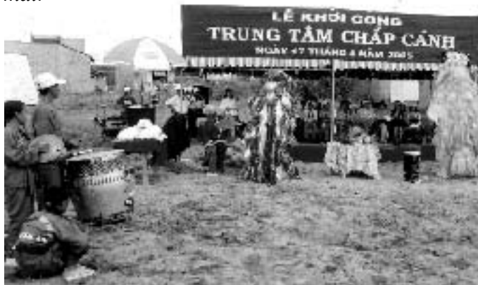
Centre Envol, 17 mai avant 10 heures: la danse des dragons

Le nouveau centre comprendra cinq classes d'alphabétisation à l'étage; la superficie des salles sera de 54 et 74 m 2 . Les bureaux de la direction et des professeurs ainsi que trois chambres pour accueillir les volontaires étrangers seront aussi à l'étage. Au rez-de-chaussée se trouveront quatre ateliers de formation professionnelle, un de couture, un de dessin, un de travail sur bois (bambou) et le quatrième d'informatique (pour les plus handicapés). Une salle