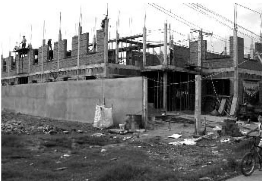
Centre Envol, début septembre, le chantier